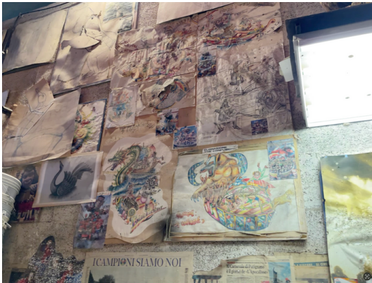
Les dessin de conception

J'ai assisté à la conception d'un char, c'est très impressionnant car tout est fait en papier mâché. Le char est dessiné tout d'abord en fonction du thème du Carnaval (cette année; le voyage dans le temps) et ensuite, toute la structure est réalisée en papier mâché (de la glue et du journal). Enfin, les chars sont peints et accessoirisés avant le défilé.