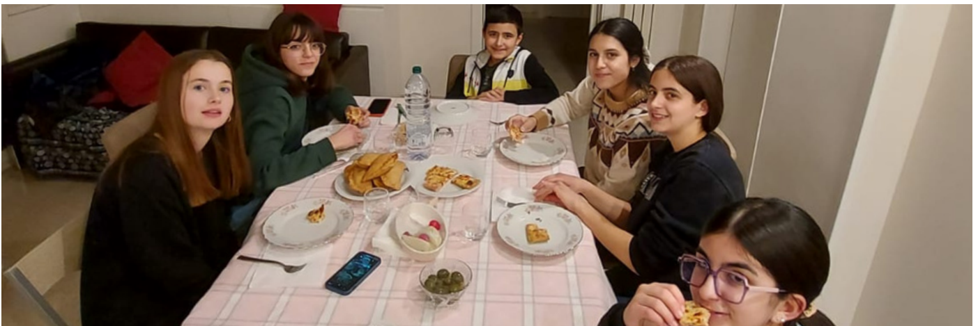
voici une photo de moi et mes cousins italiens !

Toutes les semaines nous allons manger chez les grands parents, avec les cousins et au menu : Salades, Lasagnes puis Viande avec des frites et enfin les fruit et petits gateaux accompagnés du café, autant dire : des repas de roi ! J'ai pu dicuter avec eux même si il ne parlaient ni anglais ni français, j'ai du apprendre à comprendre l'italien et à pouvoir y répondre.