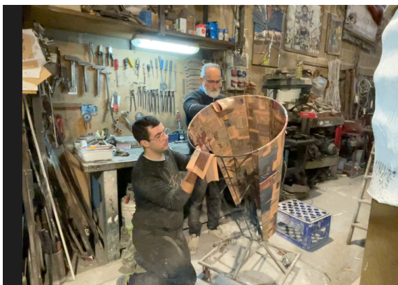
La conception des structures