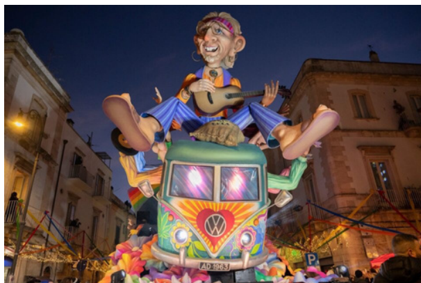
Le char, une fois terminé

De mon point de vue, le carnaval m'as permis de faire de superbes rencontres, de me rapprocher de ma correspondante et même de m'amuser en apprenant les chants et danses traditionnelles des Pouilles. Je pense que c'était la partie que j'ai préféré de ma mobilité.