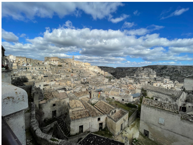
Polignano a mare