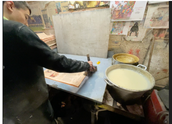
Préparation de papier mâché