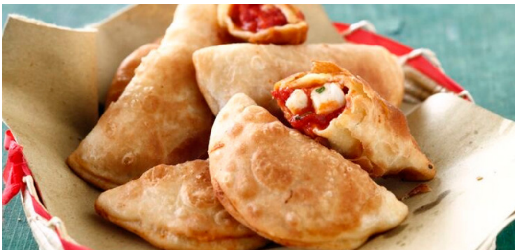
Voici des Panzeroti, c'est mon plat italien préféré !

Chaque repas était délicieux, j'ai aussi cuisiné avec ma maman et ma grand mère d'accueil, comme des pizzas, des pâtes, j'ai trouvé cela génial !!