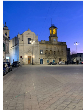
GIOIA DEL COLLE