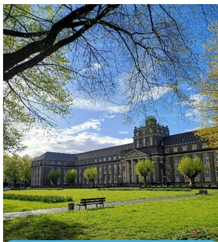
Gymnasium am Molkteplatz Krefeld