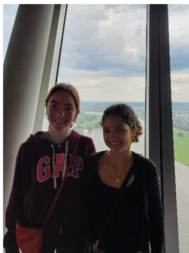
Avec ma correspondante