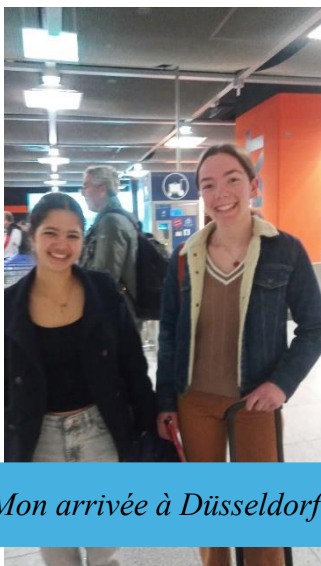
Mon arrivée à Düsseldorf