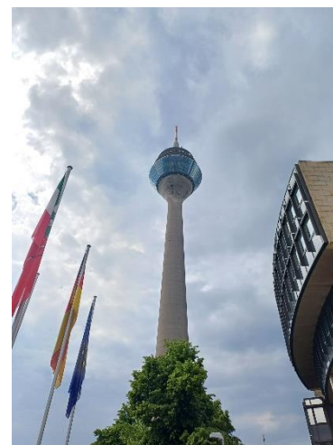
Fernsehturm de Düsseldorf