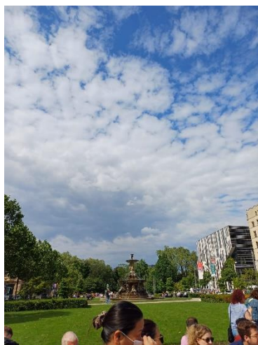
Königsallee de Düsseldorf