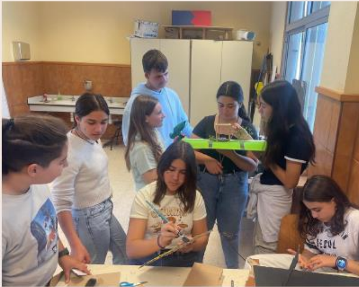
La maquette ↗