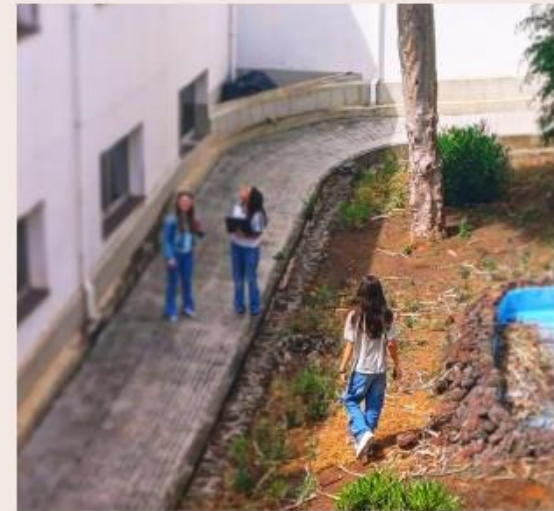
Les dimensions ↗