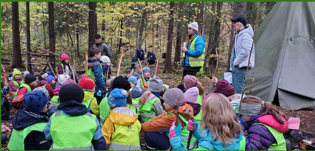
Regroupement pour les consignes avant la chasse aux trésors. Travail en équipe parfois 4 ou 2 .