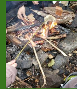
Vers 10h30 : Pause déjeuner