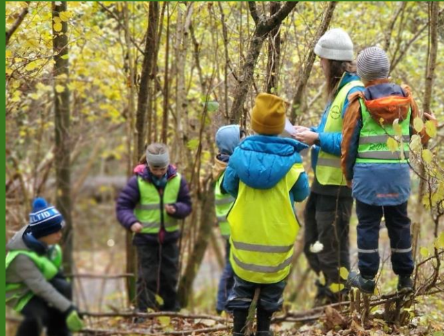
Les enfants viennent donner la réponse de la question à un des professeur qui valide ou pas. Ensuite, ils repartent chercher une autre question.