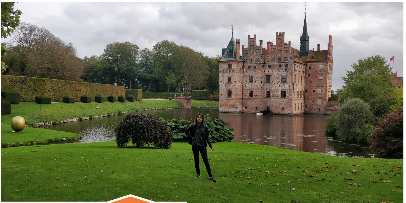
Château d'Egeskov, Funen

Lors de mon séjour au Danemark, j'ai eu la chance d'aller dans de diverses villes et à la rencontre de divers paysages. J'ai découvert les plages de la côte ouest de Jutland, Odense, la troisième plus grande ville du Danemark et bien sûr Copenhague.