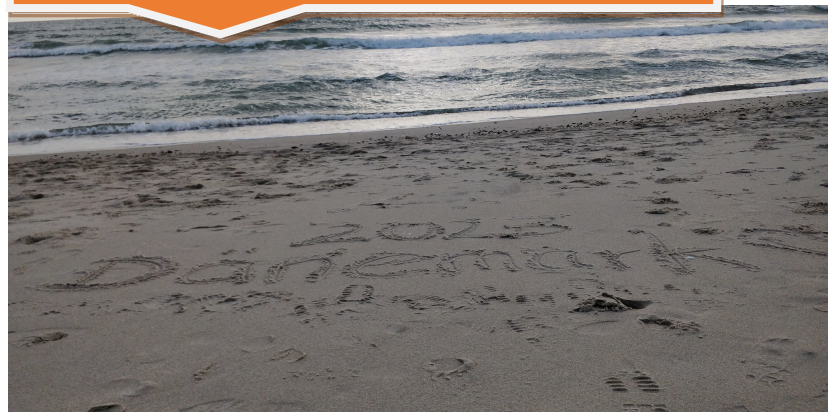
Plage de Jutland

J'ai eu la chance de voir les plages de la côte est du Danemark.